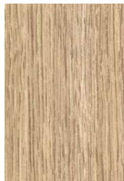
Bilder: Eiche weiß gekalkt.jpg

Neu im Küberit-Angebot: Das trendige Holzdekor Eiche weiß gekalkt für Anpassungs-, Abschluss- und Übergangsprofile.